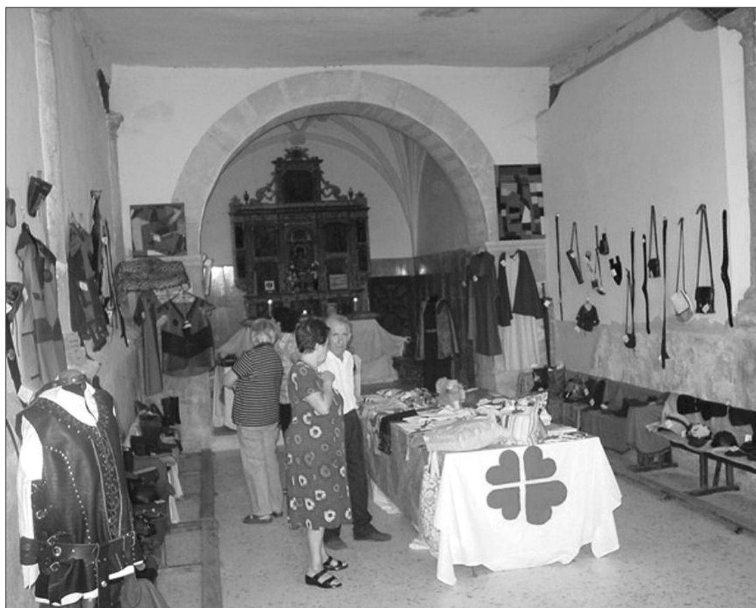
La exposición con los productos de Cáritas se ubica en la ermita del Loreto de Cella

La exposición y venta de los productos se desarrollará hasta el próximo día 4 de septiembre en la ermita del Loreto en horario de 17:30 a 20 horas. Entre los productos hay trajes y capas inspirados en el medievo y complementos en piel como bolsos o cinturones.